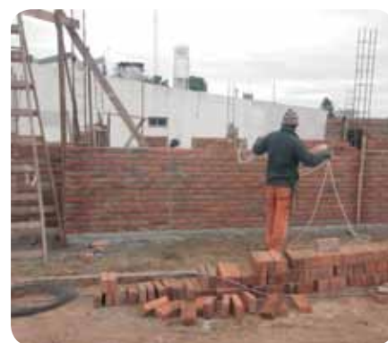
Hier entsteht die Bäckerei

Leider ist durch die starke Inflation in Argentinien und einige unvorhergesehene Verzögerungen in der ersten Bauphase der Bau des neuen geistlichen Zentrums (Stichwort: Kindertagesstätte) nun deutlich teurer geworden als geplant. Löhne werden vom Staat vorgegeben, zugesagte Preise werden von Lieferanten nicht eingehalten. Für einzelne Bau-Artikel beträgt die Inflation 3 - 5 % pro Woche! Ein Sack Zement kann so leicht innerhalb von einem Monat 20 % teurer werden, in fünf Monaten kostet er das Doppelte! Deshalb ist es wichtig, dass wir jetzt so zügig wie möglich weitermachen können. Einen Großteil der für den Bau benötigten Materialien (Holz, Steine, Fliesen usw.) ist bereits gekauft worden, um der Inflation entgegen zu steuern. Nun brauchen wir dringend weitere Finanzen, um die Arbeitslöhne bezahlen zu können und die restlichen Materialien zu kaufen.