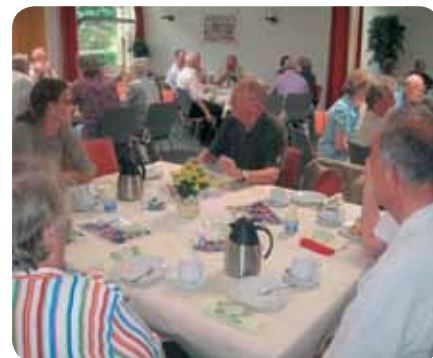
Freundestreffen in Wölmersen