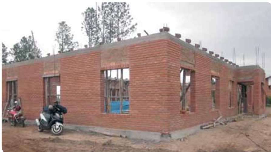
Aktueller Bautenstand des geistlichen Zentrums

Mit dem neuen Gebäude entstehen neue Chancen für Villa Adela, aber auch darüber hinaus. Durch die Zusammenarbeit mit dem Jugendamt und die Kontakte zu den Familien, aus denen die Kinder der Kindertagesstätte kommen, entstehen viele neue Möglichkeiten, das Evangelium weiterzusagen. Und selbstverständlich werden wir die gute Botschaft auch den über 100 Kindern in der Kindertagesstätte weitergeben. Hier kann eine neue Gemeinde entstehen und Menschen können geistlich frei werden und im Glauben wachsen.